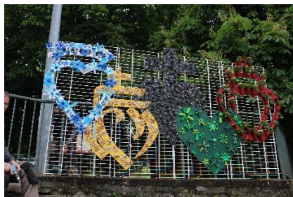
Les Cœurs vendéens par l'Union Chrétienne