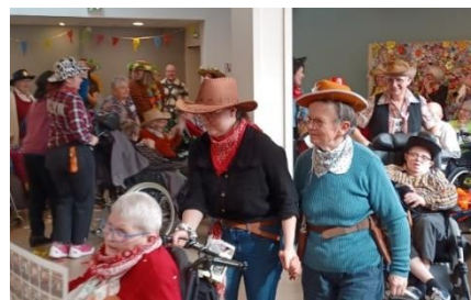
Election de Miss Mamie au Ruleau

Retrouvez-nous sur le site : https://www.alliance-mormaison.fr/ Siège social : EHPAD Charles Marguerite, 2 route de Nantes - 85190 AIZENAY.